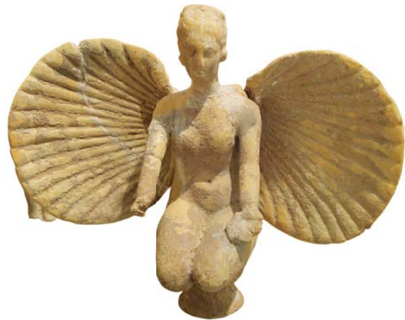
Маленькая Афродита. Археологический музей имени Ф. Рибеццо. Бриндизи, Италия