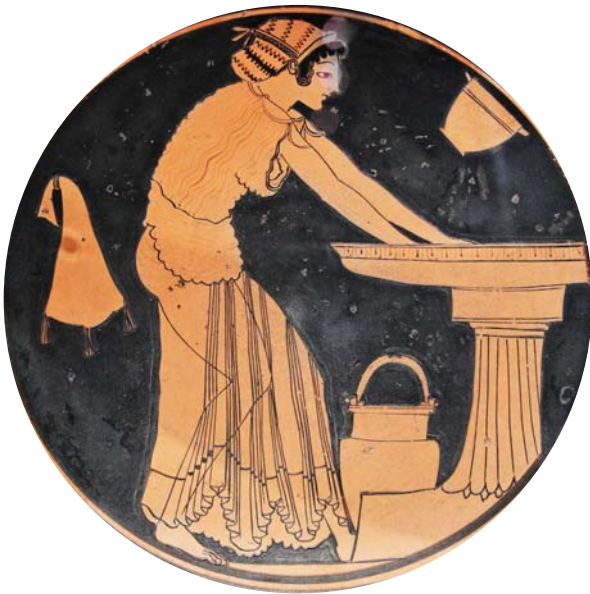
Умывающаяся женщина. Килик. Приписывается вазописцам Дурису и Евфронию. Около 500 г. до Р. Х. Метрополитен-музей, Нью-Йорк

Каждое начальное υ и ϙ получает густое придыхание .