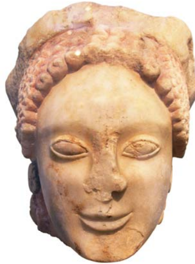
Голова Кору из Элевсина. Мрамор. Конец VI века до Р.Х. Национальный археологический музей, Афины