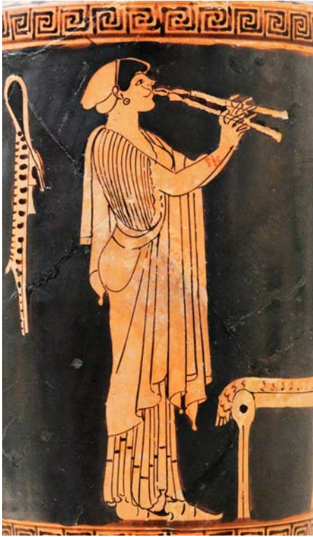
Девушка, играющая на авлосе. Лекиф. Приписывается вазописцу Бригу. Около 480 г. до Р. Х. Метрополитен-музей, Нью-Йорк

Гласные ε и ο краткие ; η и ω долгие ; α, ι, υ бывают как долгими , так и краткими звуками.