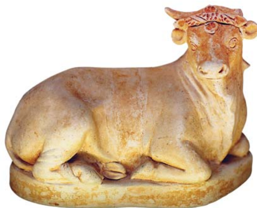
Кувшинчик для масла в форме лежащего быка. Из Кампании. 300–275 гг. до Р.Х. Британский музей, Лондон