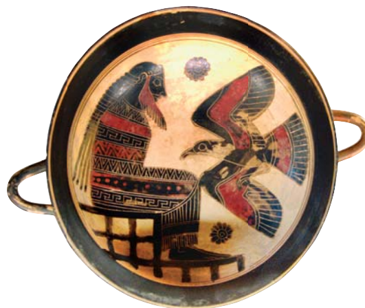
Зевс с орлом. Килик. Около 560 г. до Р. Х. Лувр, Париж