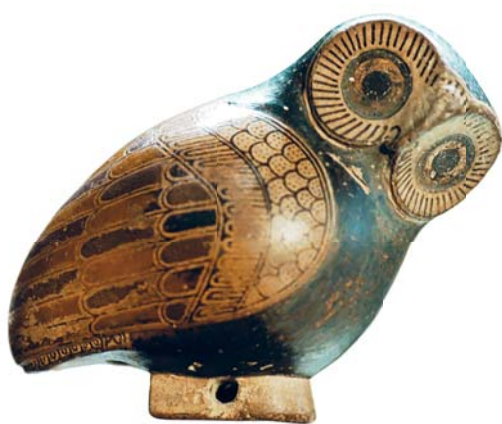
Греческий арибал в форме совы. Около 640 г. до Р. Х. Лувр, Париж