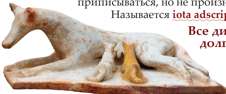
Собака со щенками. 500–475 гг. до Р.Х. Государственное античное собрание, Мюнхен