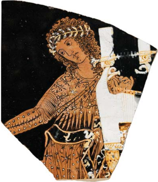
Аполлон с кифарой. Фрагмент кратера. Около 400–380 гг. до Р. Х. Метрополитен-музей, Нью-Йорк

Каждая начальная гласная и дифтонг снабжены знаком придыхания: