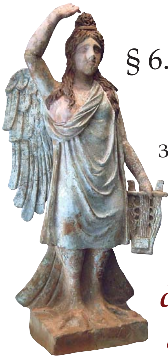
Сирена с цитрой. 340–300 гг. до Р. Х. Националь- ный археоло- гический музей Испании, Мадрид