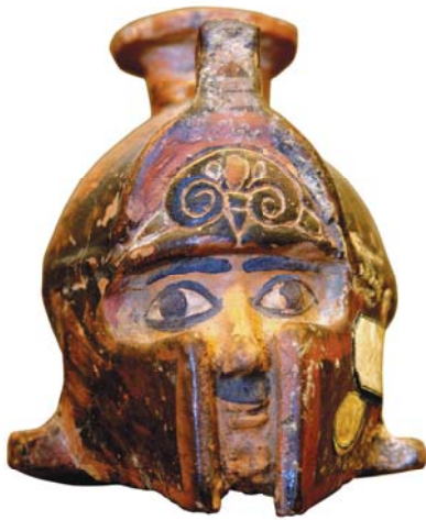
Сосуд в форме головы воина. Лувр, Париж