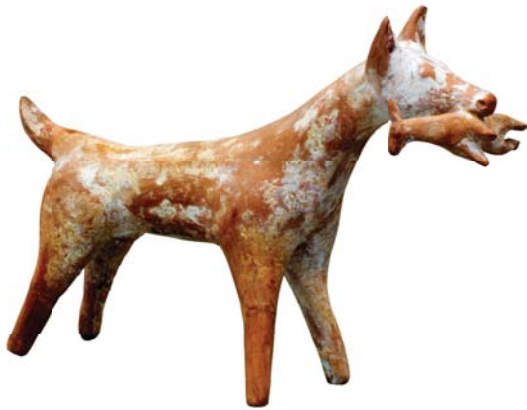
Собака с зайцем. Терракота. 500–475 г. до Р.Х. Государственное античное собрание, Мюнхен