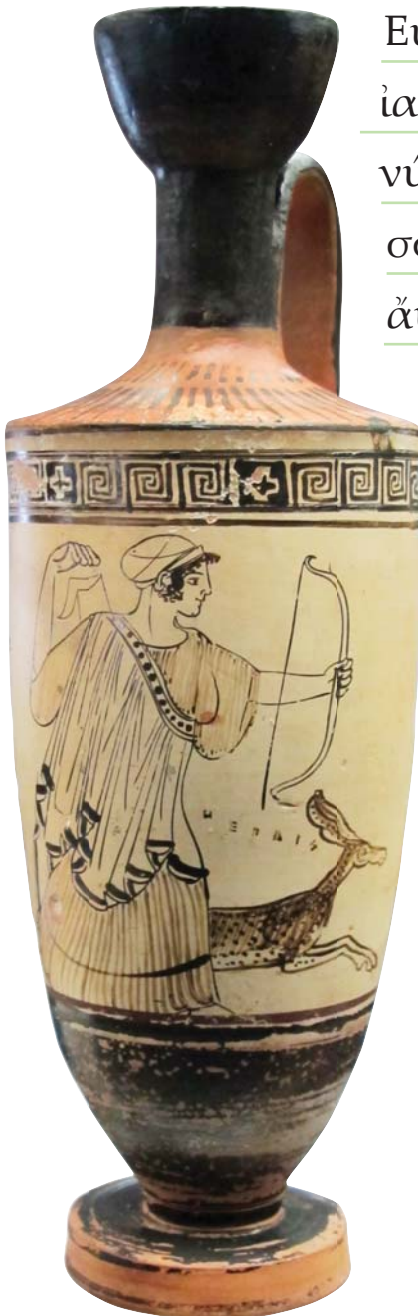
Артемида. Лекиф. Около 460–450 гг. до Р. Х. Кабинет медалей, Париж

σκηνή, τάλαντον, χορός, παρθένος, γραφή, ἡγεμών, ἰδέα, λόγος, ψάλλω, ἀγαθός.