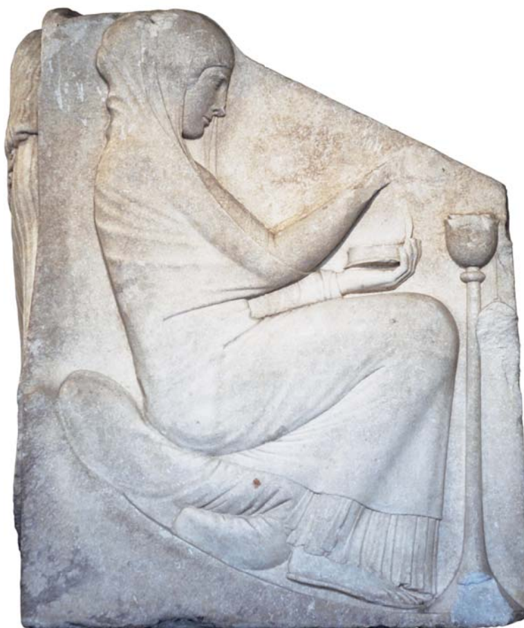
Приносящая жертву. Рельеф «Трона Людовизи». Мрамор. 460–450 гг. до Р. Х. Национальный музей Рима в палаццо Альтемпс