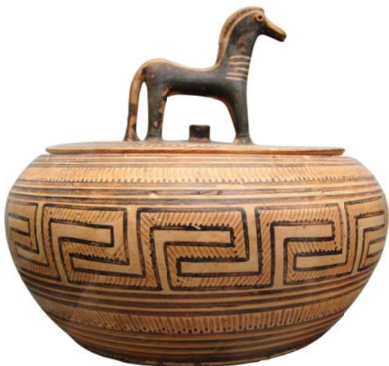
Пиксида. Около 570 г. до Р. Х. Государственное античное собрание, Мюнхен